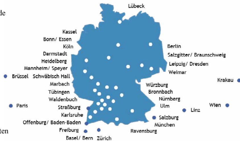
Grafik: Exkursionsziele des Instituts in den vergangenen 25 Jahren

Forschungsthemen bearbeitet oder Tagungen organisiert. Bei Exkursionen wurden Kontakte in Kulturbetriebe geknüpft und Zusammenhänge zwischen Lehrinhalten und der Berufspraxis hergestellt. Insgesamt haben die Studierenden und Lehrenden bei diesen Exkursionen